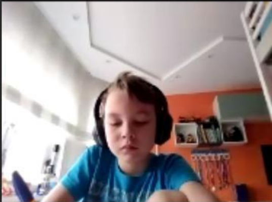
Galaxy Tab S3